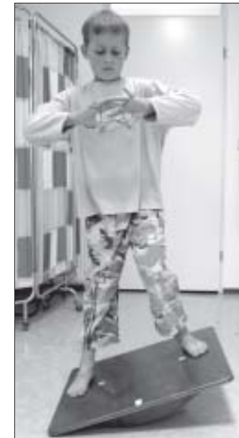
Touwspel op de wiebelplank

Het uitgangspunt is dat een kind het meeste leert wanneer het iets met plezier doet, daarom worden de lessen voor het kind zo aantrekkelijk mogelijk gemaakt. Er wordt gebruik gemaakt van veel verschillende materialen, zoals teken-, krijt-, en verfspullen, spelmateriaal (bv. knikkers, tollen, mikado, puzzels, etc.)